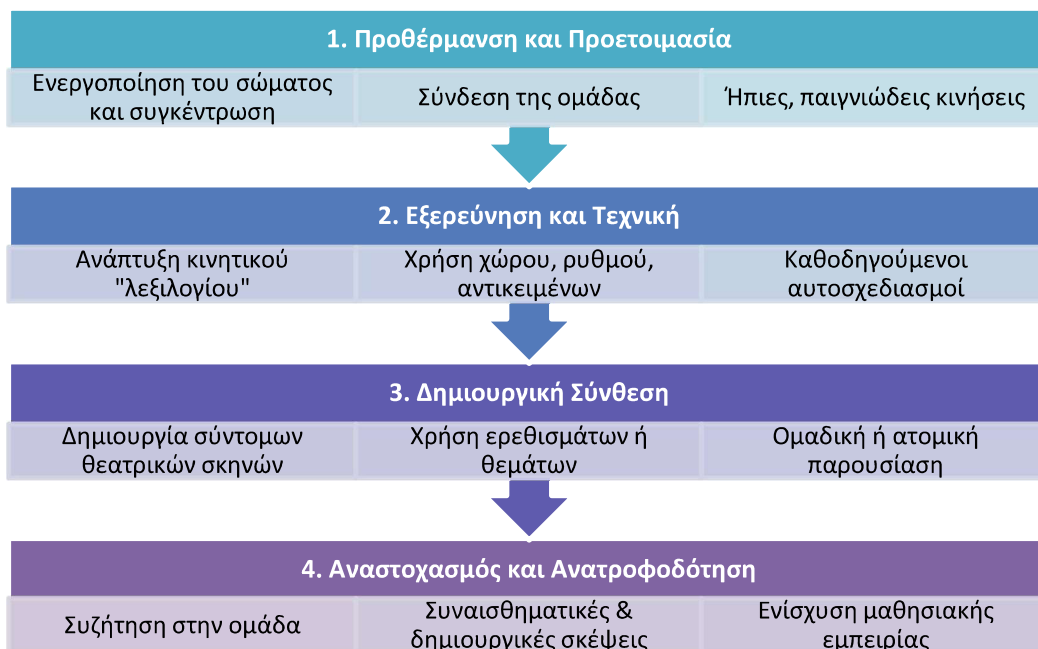
Εικόνα 3: Δομή ενός μαθήματος Κινητικού Θεάτρου

Οι συνεδρίες του ΚΘ έχουν δομημένη αλλά ευέλικτη μορφή. Συνήθως οργανώνονται στη βάση τεσσάρων εξελικτικών φάσεων, που συνδυάζουν τη σωματική δραστηριότητα με την ανάπτυξη της έκφρασης και τη συνεργατική δημιουργικότητα. Παρόλο που οι συγκεκριμένες δραστηριότητες μπορεί να διαφέρουν ανάλογα με την ηλικία και την εμπειρία των συμμετεχόντων, ο βασικός κορμός περιλαμβάνει τις εξής τέσσερις φάσεις: Προθέρμανση και Προετοιμασία, Εξερεύνηση και Τεχνική, Δημιουργική Σύνθεση και Αναστοχασμός και Ανατροφοδότηση (βλ. Εικόνα 3).